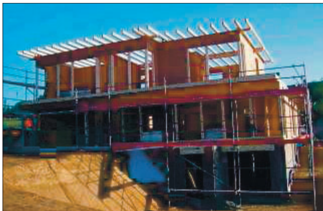
Moderne Zeiten: Häner baut Häuser aus Holz nach Wunsch.