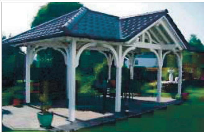
Ein kunstvoller Pavillon. Der moderne Maschinenpark bei Häner macht so etwas bezahlbar.

türlich auch für Gartenpavillons und Balkone, für Schuppen, Carports und Geländer, Tore und wie gesagt allem, was man im Holzbau anfertigen kann. Als vor drei Jahren die moderne Abbundmaschi-